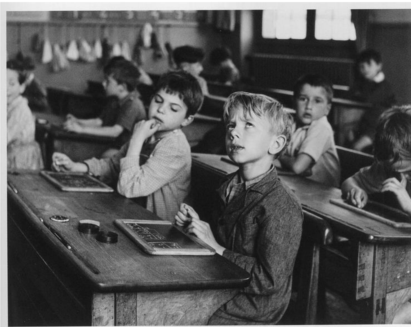
L'information scolaire - Robert DOISNEAU (1956 - l'école de la rue Buffon, dans le V ème arrondissement de Paris)