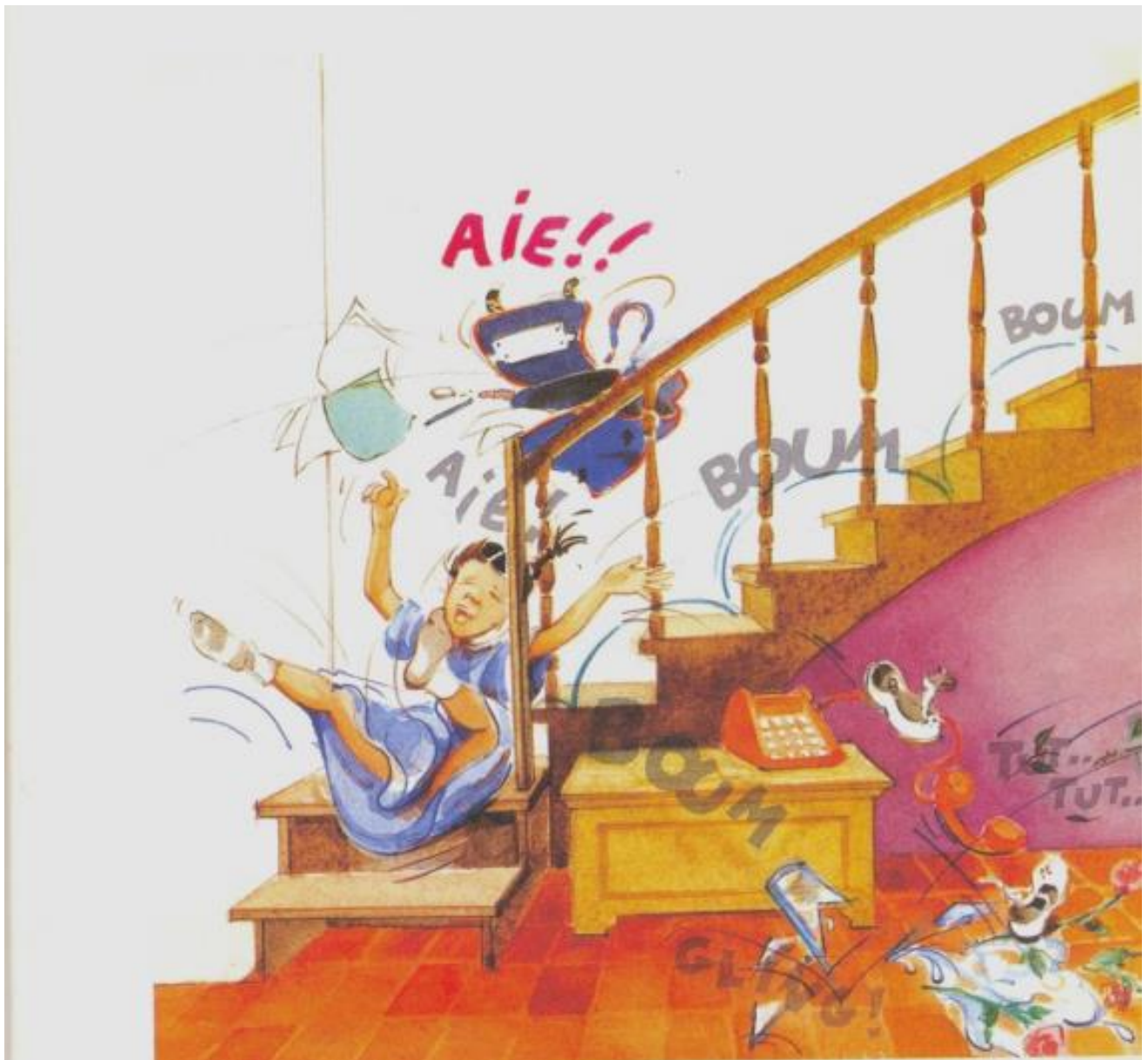
Image support extraite de l'ouvrage : Des images à parler, à lire et à écrire, démarches et outils pour la classe CNDP /CRDP du Nord Pas de Calais